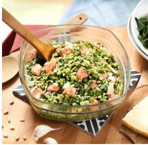
Risotto de saumon au pesto

Semaine 1 : commande à effectuer avant le 6/10 - livraison jeudi 10/10