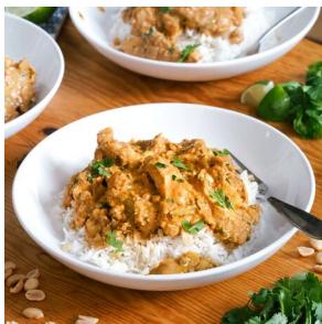
Poulet tikka massala