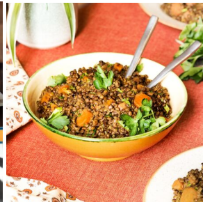
Lentilles à la marocaine

Semaine 3 : commande à effectuer avant le 20/09 - livraison jeudi 24/10