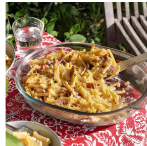
Gratin de macaronis crémeux au jambon