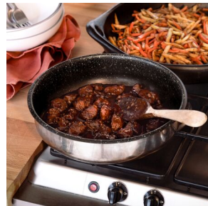
Porc laqué et frites bicolores