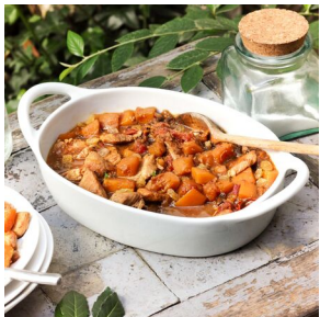
Sauté de dinde au potiron