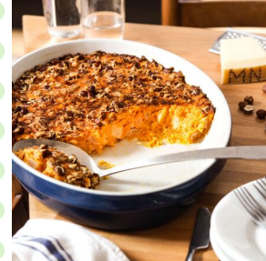
Gratin de patate douce chèvre noisettes