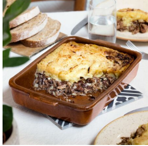
Parmentier de canard