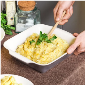
Brandade de morue

Semaine 2 : commande à effectuer avant le 13/10 - livraison jeudi 17/10