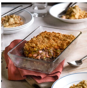
Crumble au saumon et aux poireaux

Semaine 4 : commande à effectuer avant le 27/09 - livraison jeudi 31/10