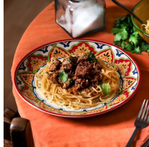
Sauté de porc à la thaï