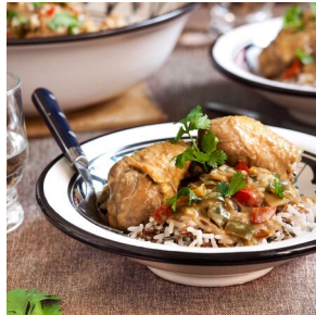
Poulet à la l'indonésienne