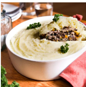
Miroton de boeuf