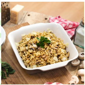
Coquillotto aux champignons