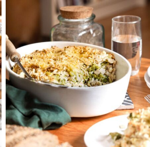
Crozets de Savoie aux légumes d'automne

Semaine 2 : commande à effectuer avant le 13/10 - livraison jeudi 17/10