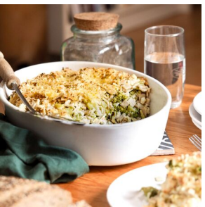
Crozets de Savoie aux légumes d'automne