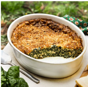
Clafoutis aux épinards

Semaine 4 : commande à effectuer avant le 27/09 - livraison jeudi 31/10