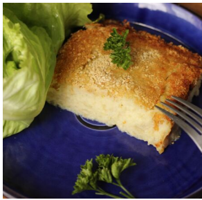
Gratin de poisson aux champignons

Semaine 3 : commande à effectuer avant le 20/09 - livraison jeudi 24/10